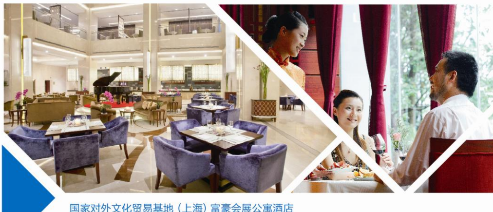
国家对外文化贸易基地（上海）富豪会展公寓酒店

酒店是国家对外文化贸易基地（上海）的配套功能设施，按星级旅游涉外饭店标准建设，集住宿、会务、餐饮、休闲、娱乐于一体的综合性商务酒店。酒店拥有282间高标准的公寓式客房，由“香港富豪酒店管理集团”管理。距离市中心人民广场26.4公里，上海浦东国际机场35.6公里。